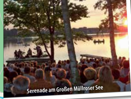
Serenade am Großen Müllroser See

„Nur wo du zu Fuß warst, bist du auch wirklich gewesen.“ (Johann Wolfgang von Goethe)