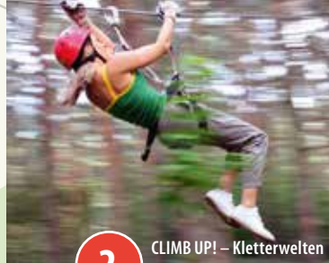
2 CLIMB UP! – Kletterwelten