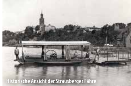
Historische Ansicht der Strausberger Fähre