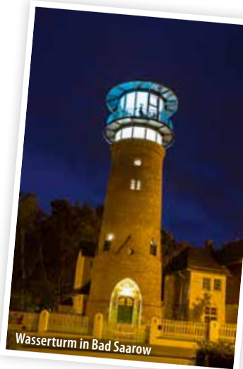
Wasserturm in Bad Saarow

Wer in der näheren Umgebung des Storkower Sees aufmerksam die Landkarte studiert, wird über untypische Ortsnamen wie Philadelphia oder Neu Boston, die so gar nicht ins Brandenburgische passen, stolpern. Es handelt sich hier nicht etwa um alte Hippie-Gemeinden, sondern um historische Kolonistendörfer aus der Zeit der Auswandererbewegung um 1748, als Friedrich II. Bürgern Land zuteilte, damit sie nicht nach Amerika gingen. Es war auch derselbe König,