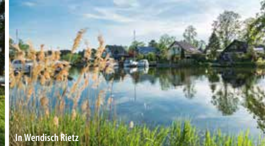
In Wendisch Rietz